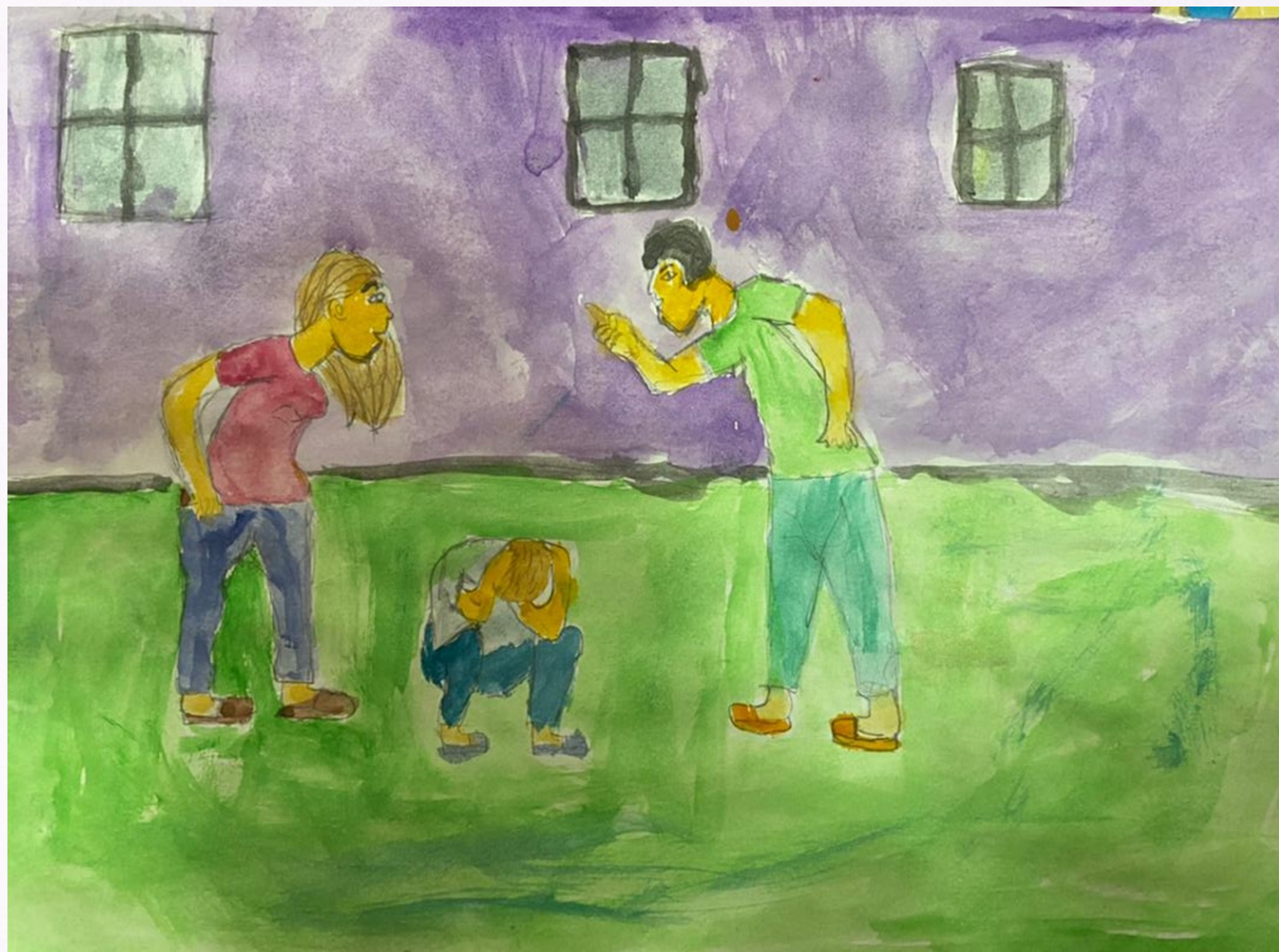
Ысманов Мыктыбек «Уй-булодогу чыр-чатак»